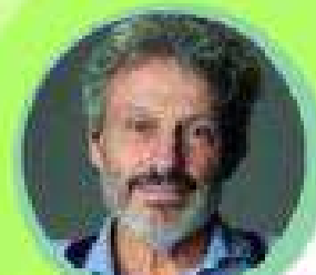
Vittorio Emanuele Parsi

A seguire sarà offerto un rinfresco a cura di Caffetteria Pime